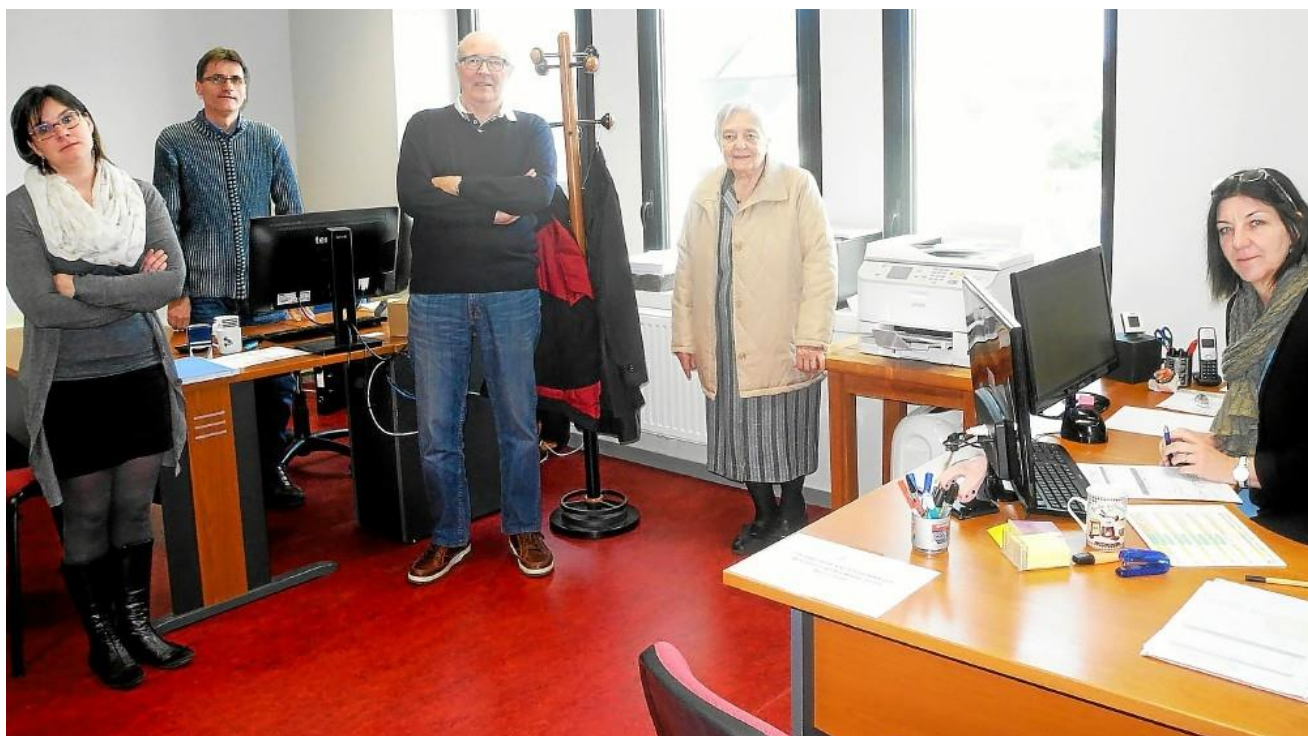
Depuis un an, l'ADMR a de nouveaux locaux au pôle des services.

L'Association ADMR de Scaër (Aide à domicile en milieu rural) peut intervenir dans tous les domaines de la vie quotidienne : aide à domicile, garde d'enfants, aide aux personnes âgées et/ou handicapées... Cette association scaéroise a bientôt 60 ans d'existence et emploie 35 salariées en CDI. Elles ont effectué l'an passé 40.700 heures de travail. Des aides financières peuvent être allouées par le Conseil départemental, les Caisses de retraite, les mutuelles, la Caf... Une défiscalisation est possible dans les limites de la réglementation en vigueur. L'assemblée générale de l'association se tiendra le vendredi 25 mai, à la MJC, à partir de 19 h.