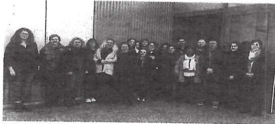
Les douze stagiaires aux côtés des responsables des ADMR à l'origine de cette opération de formation.

Ce dispositif permet en effet de pallier les difficultés de recrutement des personnels des ADMR. D'autant que des départs à la retraite sont attendus dans les années à venir. « Cette