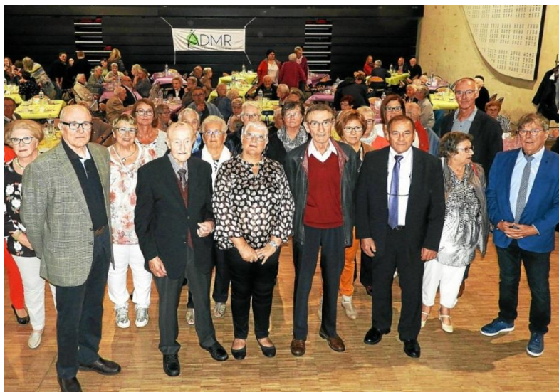
Les élus locaux et départementaux, le conseil d'administration et les anciens responsables de l'ADMR.

L'ADMR (Association d'aide à domicile en milieu rural) locale fêtait ses 60 ans au service de la population, samedi après-midi, à l'Espace Youenn-Gwernig.