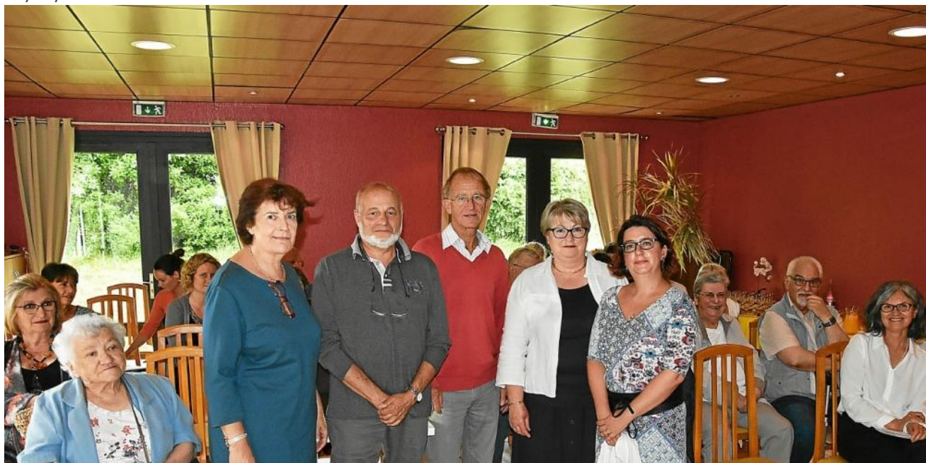
Le bureau de l'association accueillait ses membres jeudi au Novalis.

En janvier 2019, l'activité de soins de l'ALDS (Association locale de développement sanitaire de Quimperlé), passera sous l'égide du groupement hospitalier Bretagne Sud.