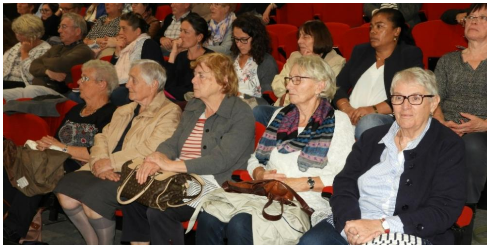
Ce GCSMS mutualise les moyens et les compétences sur le Sud-Est du département.

L'assemblée générale du Groupement de coopération sociale et médico-sociale (GCSMS) des pays de l'Aven s'est tenue, jeudi dernier, à l'Espace Youenn-Gwernig, devant une quarantaine de personnes, dont 19 délégués (bénévoles des associations locales ADMR). Le GCSMS réunit huit associations* d'aide à domicile en milieu rural (ADMR).